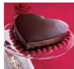
Hvad ligger dit hjerte nærmest?