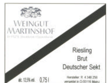
Sekt etiket fra Weingut Martinshof.

Denne udvikling hen mod sekt lavet af god grundvin viser at offentlighedens bevidsthed angående kvalitet er blevet skærpet. Mange forbrugere har erkendt at gode materialer fra starten, som ved vin, er basis for kvalitet.