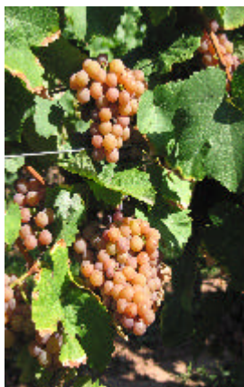
Her ses den, med sin farve, letgenkendelige Grauburgunder drue.