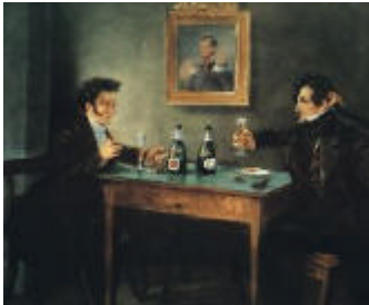
Digteren E. T. A. Hoffmann (TV) og skuespilleren Ludwig Devrient 1815 i vinkælderen "Lutter & Wagner" i Berlin.