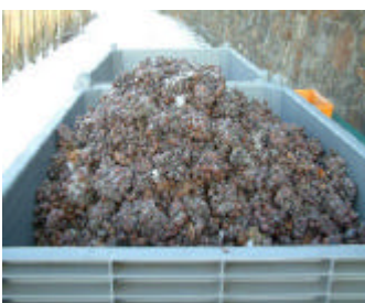
Nu er de frosne druer plukket og skal transporteres ind til vingårdens presse maskine.