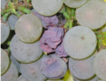
I midten af billedet kan man se druer, som er angrebet af "den ædle råddenskab".

Hvornår dette sammenspil imellem denne ædel råddenskab og druerne er begyndt ved ingen præcist. Personligt tror jeg at den altid har været der, men det er først relativt sent man er blevet den bevidst.