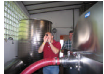
Her står jeg og måler mostvægten for Weingut Martinshof i høsten 2005.

Vinbonden går ud på marken og høstede et par drueklaser, nogle fra solsiden og nogle fra skyggesiden af vinrankerne. Disse bliver presser så han kan bedømme sukker indholdet i mosten ved hjælp af et