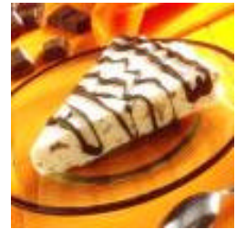
Hvad skal man mon drikke til denne dessert?

Milde Auslese vine som Riesling eller Grauburgunder er velkomne her.