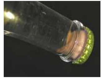
Gærproppen ses til højre i billedet.