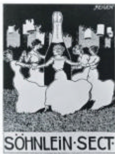
Gammel plakat fra sekt huset Söhnlein.

I 1900 satte navnet sekt sig for alvor igennem i forbindelse med produktionen af tysk skummende vin. Den første store opblomstring oplevede sekt kulturen omkring Belle Époque – tiden med de svømmende paladser på Atlanten og de strålende baller i salene på Grand Hotel i metropolerne og på kurstederne.